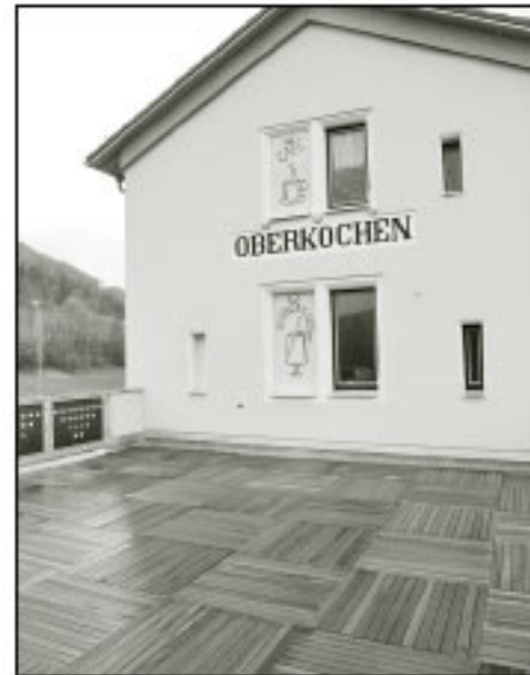
Relaxen auf der Dachterrasse.

Wir gratulieren zur Eröffnung! KASSEN-HÄGE Langenau GmbH Telefon (07345) 7603, Fax 3798